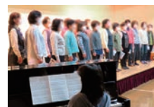
新婦人めだかコーラス