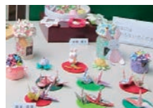
おりがみで楽しむ会